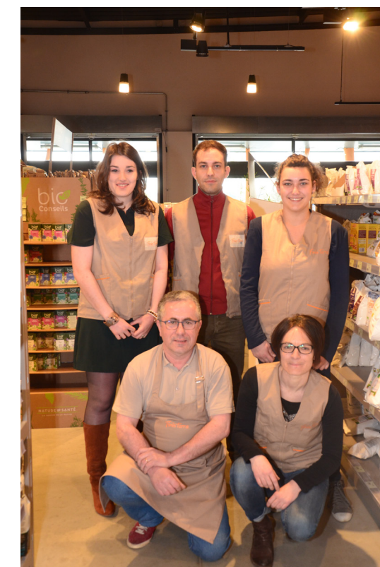
L'équipe se tient fin prête à vous accueillir à Kastell Bio.

Tout au long de l'année, de nombreux producteurs ou transformateurs locaux dont des maraîchers livreront le magasin au fil des saisons.